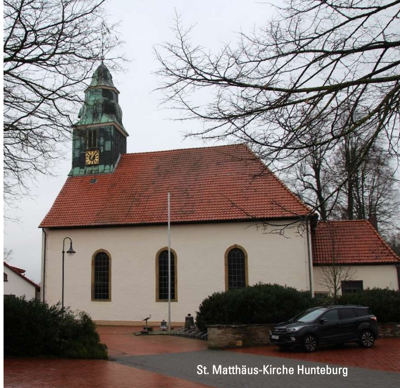
St. Matthäus-Kirche Hunteburg