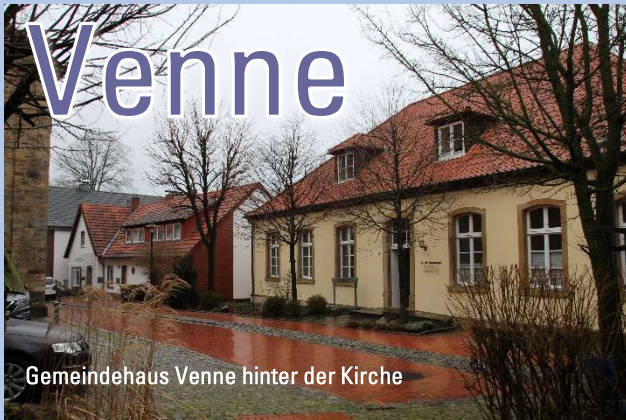
Gemeindehaus Venne hinter der Kirche

Venne, ein liebenswertes Dorf der Gegensätze. Am einen Ende, dem Venner Berg, ist es ganz schön hoch, am anderen Ende, dem Venner Moor, ziemlich niedrig.