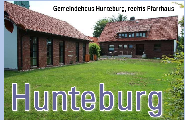
Gemeindehaus Hunteburg, rechts Pfarrhaus